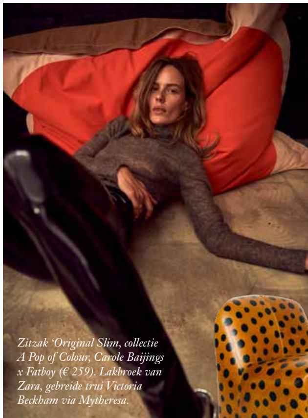
Zitzak 'Original Slim, collectie A Pop of Colour, Carole Baijings x Fatboy (€ 259). Lakbroek van Zara, gebreide trui Victoria Beckham via Mytheresa.